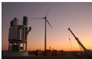
Achat de certificats verts