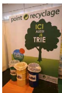
Tri sélectif, Planète Durable®2008

Planète Durable®, 1er salon annuel grand public 100% dédié à la consommation durable, est le rendez-vous incontournable de la consommation durable. Organisé du 2 au 5 avril, il s'annonce comme l'un des temps forts de la « Semaine du développement durable » ! Pendant les 4 jours du salon, les visiteurs découvriront les solutions tendances pour diminuer l'impact des gestes quotidiens sur l'environnement et se familiariseront avec un nouveau style de vie. Le salon a décidé d'aller encore plus loin ! Planète Durable® a mis en place une démarche d'éco-conception dès la 1ère édition en 2008, articulée autour du triptyque évaluer/réduire/compenser. Plus qu'un salon, Planète Durable est un événement engagé, responsable et solidaire