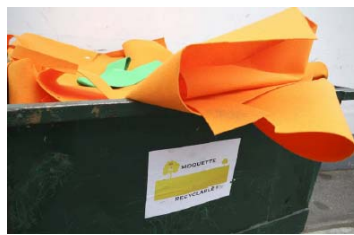
Moquette recyclée, Planète Durable®2008