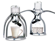
Cafetière Presso Marcel Green