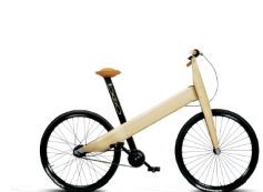
Vélo en bambou Fritsch