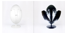
Poubelle de tri Ovetto