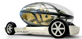
Véhicule à pile combustible Fritsch