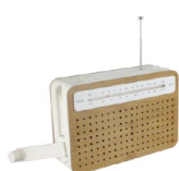
Radio écolo Décodurable