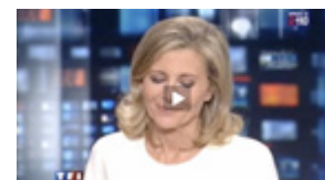
Reportage Salon 2010 (Le JT de 20h de TF1)

Parmi les premières animations des exposants : massages des mains assortis d'une découverte des huiles végétales et huiles essentielles proposés les après midis du samedi et dimanche par le Laboratoire Weleda ; découverte du barbecue solaire et son kit complet (panneau four solaire, marmite, thermomètre, grille...) par Nature & Découvertes ; tests à l'aveugle d'eau du robinet au bar à eau de Lyonnaise des Eaux ; dégustation d'eau et présentation des fameuses carafes design et pratiques d' Eau de Paris ; contact surprenant avec une énorme poule qui déambulera dans les allées, échappée de l'espace PMAF (Protection